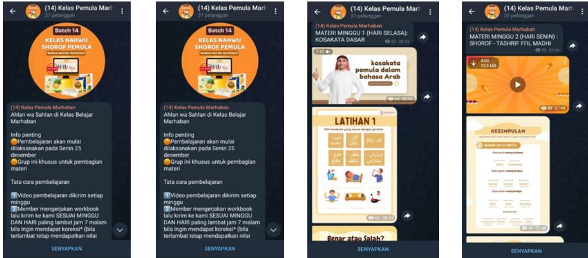
صورة مجموعة تليغرام مرحبا أكاديمي

ج. إثارة المهارات المعرفية والعاطفية والحركية النفسية فيما يتعلق بالمادة المقدمة د. يساعد على ذاكرة الطلاب لأن طبيعة وسائل التعلم لديها قوة تحفيز أقوى في رأيي، تعد الوسائط التعليمية أداة لتوفير المواد التعليمية للطلاب حتى يتمكنوا من الفهم بسهولة وعدم الملل والإبداع في الدرس. مجموعة تليغرام مرحبا أكاديمي