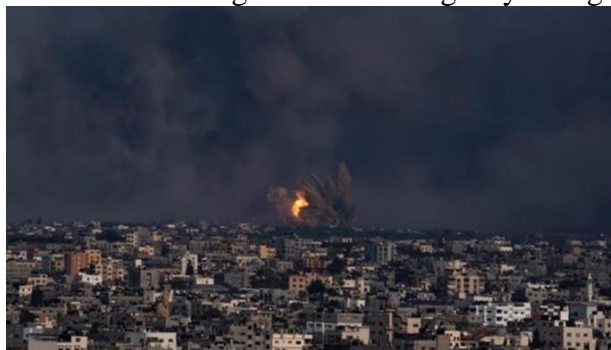
Gambar A.15. Api dan asap membubung menyusul serangan udara Israel, di Kota Gaza, 8 Oktober 2023

Dalam situasi ini, Indonesia mempertahankan keterlibatan proaktifnya dalam upaya penyelesaian konflik di Palestina dan mengevaluasi hubungannya dengan Israel.