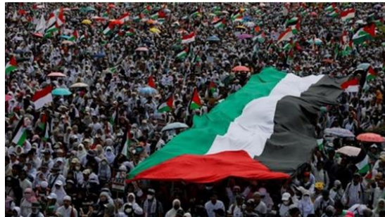
Gambar A.9.. Aksi yang diinisiasi Majelis Ulama Indonesia (MUI) ini dimulai pukul 06.00 WIB. Massa memulai long march dari Patung Kuda.

Kesembilan , Indonesia memiliki potensi untuk memainkan peran krusial dalam upaya penyelesaian konflik ini. Dukungan yang dapat diberikan oleh Indonesia tidak hanya melibatkan bantuan materi kepada Palestina, tetapi juga mencakup diplomasi terkait hubungan dengan Israel.