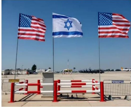
Gambar A.7 Bendera Israel dan Amerika Serikat berkibar selama latihan terakhir untuk upacara penyambutan Presiden AS Joe Biden menjelang kunjungannya ke Israel, di bandara Internasional Ben Gurion, Lod dekat Tel Aviv, Israel, 12 Juli 2022.

Konflik antara Israel dan Palestina memiliki dasar-dasar sejarah, politik, dan budaya yang telah menjadi pemicu pertentangan tersebut. Peran nasionalisme sangat signifikan dalam konflik ini, dengan munculnya gerakan nasionalis Yahudi dan Palestina yang turut menyumbang pada benturan identitas dan aspirasi. Keputusan PBB pada tahun 1947 untuk membagi wilayah Palestina menjadi negara Yahudi dan negara Arab terpisah dianggap sebagai titik balik krusial dalam perkembangan konflik ini. Pemimpin Yahudi menerima pembentukan ini, namun pemimpin Arab menolaknya, memicu konflik besar antara pasukan Yahudi dan Arab. Pada tahun 1948, negara Israel secara sah terbentuk.