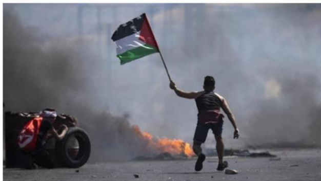
Gambar A.3 .Seorang pengunjuk rasa mengibarkan bendera Palestina selama bentrokan dengan pasukan Israel di pos pemeriksaan Hawara, selatan kota Nablus, Tepi Barat, Jumat, 14 Mei 2021.