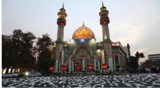
Gambar B.21. Kafan simbolis mayat anak-anak Gaza terlihat saat memberi isyarat di sebuah jalan di Teheran, Iran 13 November 2023.

dengan mayoritas penduduk Yahudi, sementara Palestina dianggap sebagai negara dengan mayoritas penduduk Muslim. Dalam kerangka konflik ini, agama dan budaya digunakan sebagai alat untuk memperbesar pertarungan dan memperdalam perpecahan di antara masyarakat. Contohnya, Israel tidak hanya berseteru dengan umat Islam, melainkan juga dengan penganut agama lain, termasuk umat Kristen. Selain itu, Israel melakukan serangan udara terhadap Gereja Ortodoks Yunani Saint Porphyrius di Gaza, yang menjadi tempat pengungsian sekitar 500 warga Palestina Muslim dan Kristen. (Thea Fathanah Arbar, 2023).