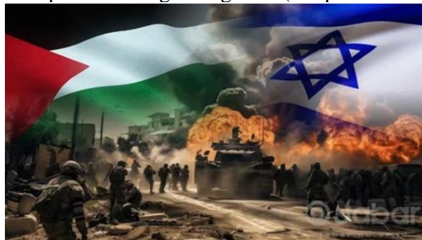
Gambar A.17. Konflik Israel-Palestina Tidak Bisa Direduksi Sebagai Konflik Agama

Secara keseluruhan, unsur politik memiliki peran yang signifikan dalam konflik Israel-Palestina, memengaruhi perkembangan dan penyelesaian konflik tersebut. Ketegangan antar negara di wilayah tersebut muncul sebagai dampak dari konflik ini, dan hubungan diplomatik antarnegara terpengaruh. Beberapa negara, termasuk Turki, berupaya menjadi penengah dalam menyelesaikan konflik ini. Meski demikian, peranan Amerika Serikat sebagai mediator juga turut memengaruhi dinamika politik di tingkat regional (Asep Muhamad Iqbal, 2023),