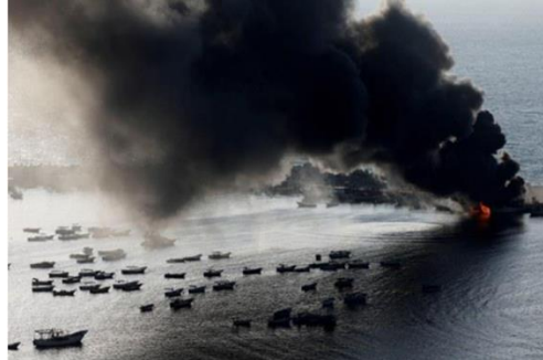
Gambar A. 18. Asap mengepul setelah serangan Israel di pelabuhan Kota Gaza, di Gaza, 10 Oktober 2023.

keuangan global, termasuk Indonesia. Dalam waktu singkat, investor mungkin beralih ke aset aman, menekan nilai tukar rupiah, dan berpotensi menyebabkan inflasi serta pelemahan mata uang. Untuk mencapai perdamaian berkelanjutan, dibutuhkan upaya komprehensif dan berkelanjutan dari semua pihak yang terlibat dalam konflik (Nazarudin Latif, 2023).