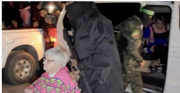
Gambar A.5. Tangkapan layar dari video menunjukkan sepuluh sandera "Israel" di Jalur Gaza diserahkan kepada Komite Palang Merah Internasional (ICRC) di Rafah, Gaza pada 29 November 2023.

Pada Rabu (29/11/2023), Israel tidak dapat menyembunyikan kemarahannya terkait rekaman yang menunjukkan pejuang Hamas dan tawanan Israel memberi isyarat saat diserahkan kepada tim Palang Merah di Jalur Gaza, seperti yang dilaporkan oleh Anadolu Agency. Rekaman ini muncul ketika stasiun televisi Israel melaporkan bahwa keluarga tawanan Israel menyatakan bahwa kerabat mereka diperlakukan dengan baik selama penahanan mereka. Pembebasan tawanan pemukim Israel oleh Mujahidin Al-Qassam terjadi dalam gelombang pertukaran keempat, dan seluruh tawanan Israel dinyatakan dalam kondisi sehat walafiat. Ditegaskan bahwa perintah Syariat Islam untuk memuliakan para tawanan sepenuhnya dijalankan oleh Mujahidin Palestina di Gaza. (Budi Ashari, 2023)