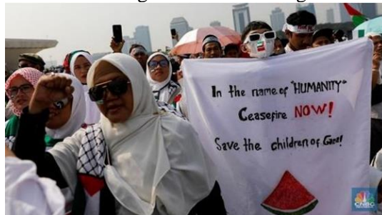
Gambar A.10. Peserta aksi membawa poster hingga spanduk menghentikan perang di Gaza.