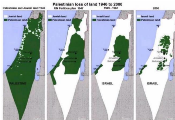
Gambar A.2 . Palestinian loss land 1946 to 2000

Ketiga , Pertikaian antara Israel dan Palestina melibatkan perselisihan dan klaim atas wilayah yang serupa, seperti Yerusalem, yang diakui sebagai ibu kota oleh keduanya dan merupakan pusat kehidupan agama dan budaya mereka. (RBF/NAT-Humkoler UNPAR, 2023)