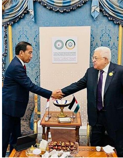
Gambar A.12. Presiden Joko Widodo dan Mahmoud Abbas dalam pembicaraan bilateral di sela-sela KTT Luar Biasa Organisasi Kerja Sama Islam di Riyadh pada 11 November 2023.

Kesepuluh, Indonesia telah memberikan dukungan kepada Palestina dalam perjuangannya untuk meraih kemerdekaan, serta menghormati hak-hak mereka. Negara ini juga turut mendukung upaya Palestina dalam menentang kehadiran Israel di wilayah mereka.