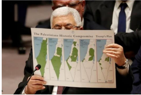
Gambar A.1 Presiden Palestina Mahmoud Abbas memegang peta yang menunjukkan Negara Palestina di masa depan berdasarkan rencana perdamaian Presiden AS Donald Trump dalam pertemuan Dewan Keamanan PBB di New York, pada 11 Februari 2020.

Kedua , Pembagian Palestina menjadi dua entitas, yaitu negara Arab dan negara Yahudi pada tahun 1947, segmen penting dalam sejarah konflik Israel-Palestina. Meskipun demikian, pendirian negara Israel pada tahun 1948 memicu konflik besar antara pasukan Yahudi dan pasukan Arab. (Asep Muhamad Iqbal, 2023)