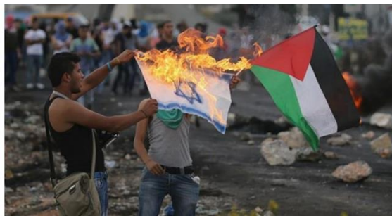
Gambar B.20. Konflik Israel-Palestina yang sebenarnya bersumber dari persaingan kekuasaan antara kedua negara, dinilai makin keruh dan menahun karena dikaitkan agama.

Kedua , Penggunaan agama juga telah dimanfaatkan sebagai sarana untuk memperburuk konflik antara Israel dan Palestina. Menurut Lina Fattom, seorang peneliti Amnesty International yang fokus pada Palestina, agama digunakan sebagai alat untuk memperkeruh konflik tersebut, meskipun sebenarnya akarnya berasal dari persaingan kekuasaan antara kedua negara.