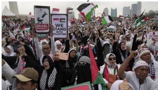
Gambar A.11. Aksi ini bertujuan sebagai tekanan publik untuk melawan penjajahan Israel. Baginya.