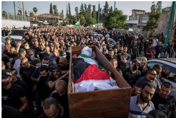
Gambar A.8. Warga Palestina membawa peti seorang lelaki Arab Israel berusia 25 tahun yang tewas ditembak saat kerusuhan di kota Lod, pada 11 Mei 2011.

Konflik antara Israel dan Palestina memiliki dasar-dasar sejarah, politik, dan budaya yang telah menjadi pemicu pertentangan tersebut. Peran nasionalisme sangat signifikan dalam konflik ini, dengan munculnya gerakan nasionalis Yahudi dan Palestina yang turut menyumbang pada benturan identitas dan aspirasi. Keputusan PBB pada tahun 1947 untuk membagi wilayah Palestina menjadi negara Yahudi dan negara Arab terpisah dianggap sebagai titik balik krusial dalam perkembangan konflik ini. Pemimpin Yahudi menerima pembentukan ini, namun pemimpin Arab menolaknya, memicu konflik besar antara pasukan Yahudi dan Arab. Pada tahun 1948, negara Israel secara sah terbentuk.