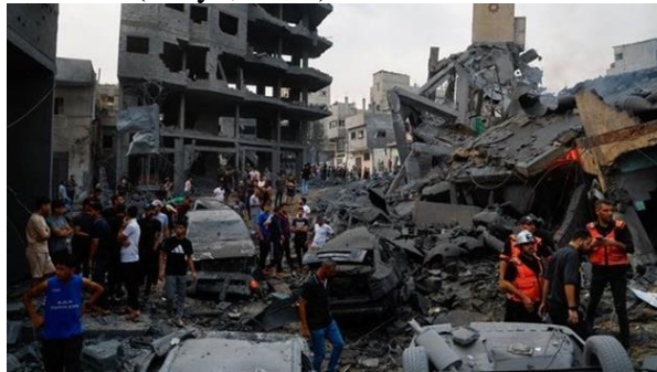
Gambar A.14. Konflik Palestina-Israel kembali muncul dalam beberapa hari terakhir. Hal ini dipicu oleh serangan Hamas terhadap Israel di Jalur Gaza bagian selatan pada Sabtu, 7 Oktober 2023.