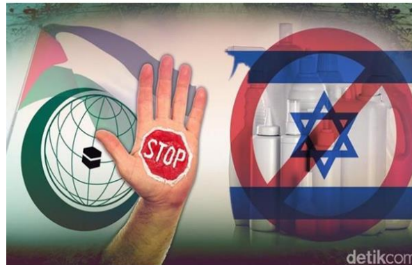
Gambar A. 6. Inset Boikot Produk Israel. (Foto: Ilustrasi oleh Andhika Akbarayansyah

Keenam , Menolak menggunakan produk-produk Israel adalah cara untuk menyatakan ketidaksetujuan terhadap kebijakan politik yang dianggap tidak etis. Konsekuensi terhadap keputusan investor perlu dievaluasi dengan mempertimbangkan keseluruhan portfolio investasi mereka. Meskipun upaya internasional telah dilakukan untuk mencapai perdamaian dalam konflik Israel-Palestina, seperti Perjanjian Oslo 1993 yang membentuk Otoritas Palestina, masih ada masalah yang belum terselesaikan dalam konflik tersebut.