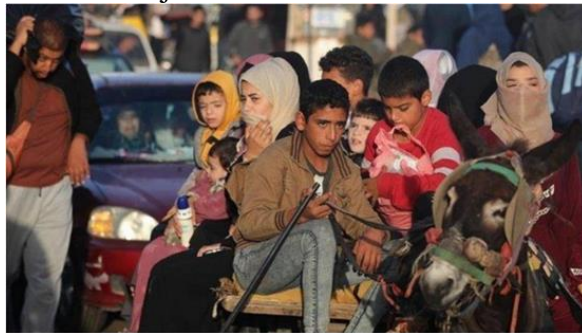
Gambar A.4. Warga Palestina yang mengungsi akibat serangan Israel selama berminggu-minggu di Jalur Gaza mulai kembali ke rumah mereka, Jumat (24/11/2023)

Keempat , Pengungsi Palestina sejak 1948 ditolak oleh Israel karena Israel menganggap rakyat Yahudi akan menjadi minoritas.