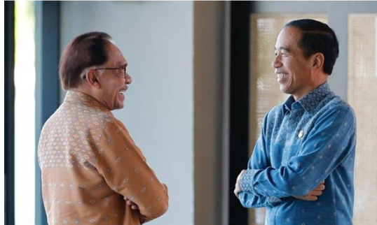
Gambar A.13. Presiden Indonesia Joko “Jokowi” Widodo (kanan) berbicara dengan Perdana Menteri Malaysia Anwar Ibrahim di sela-sela KTT Perhimpunan Bangsa-Bangsa Asia Tenggara (ASEAN) di Labuan Bajo, provinsi Nusa Tenggara Timur, Indonesia, 11 Mei 2023.

Kesebelas, Indonesia tidak memiliki hubungan diplomatik dengan Israel. Namun, Indonesia mengkaji akses Israel melalui saluran hubungan dengan palestina.