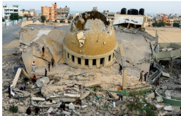
Gambar B.22. Masjid di Gaza yang hancur akibat serangan udara Israel.

Walaupun agama memiliki peran dalam memengaruhi ketegangan ini, perlu diingat bahwa konflik Israel-Palestina bukan semata-mata konflik berbasis agama. Lebih tepatnya, konflik ini terkait dengan persaingan kekuasaan dan perbedaan dalam usaha mengendalikan wilayah serta sumber daya alam di kawasan tersebut. (Wahyudhi, J., 2011)