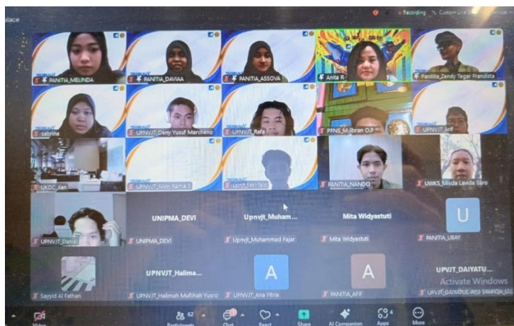
Gambar 2. Dokumentasi pelaksanaan Webinar

Partisipasi aktif webinar diikuti 84 peserta secara online yang diikuti oleh beberapa mahasiswa dari berbagai universitas dan Partisipasi yang tinggi ini menunjukkan minat yang besar terhadap webinar yang diselenggarakan oleh PT agrodana futures cabang surabaya, setelah mengikuti webinar mahasiswa menunjukkan peningkatan signifikan dalam pemahaman mereka tentang analisis fundamental dan teknikal. Mereka mampu menerapkan konsep yang dipelajari dalam simulasi perdagangan yang menunjukkan peningkatan keterampilan analitis dan kepercayaan diri dalam membuat keputusan investasi.