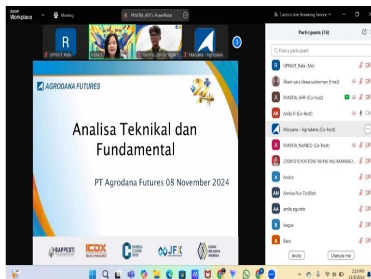
Gambar 1. Dokumentasi pemaparan materi

Melalui pelaksanaan kegiatan webinar analisis fundamental vs analisis teknikal oleh PT. Agrodana Futures cabang Surabaya berhasil mencapai beberapa hasil positif, antara lain sebagai berikut