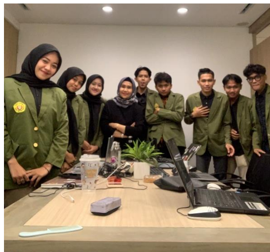
Gambar 5. dokumentasi webinar Analisis fundamental vs teknikal

Partisipasi aktif dalam kuis / mini games yang diselenggarakan melalui webinar yang bertujuan untuk mengukur pemahaman peserta agar mengetahui tingkat pemahaman mahasiswa terhadap materi yang telah disampaikan dalam webinar dan meningkatkan partisipasi untuk menciptakan suasana pembelajaran yang interaktif dan menyenangkan selama pelaksanaan webinar dan peserta berkesempatan mendapatkan doorprizee. Peningkatan pengetahuan mahasiswa peserta webinar menunjukkan peningkatan pemahaman yang signifikan peserta menunjukkan pemahaman yang lebih baik tentang analisis fundamental vs teknikal berdasarkan hasil kuis evaluasi. Jenis kuis yang digunakan adalah Post-test yang dilaksanakan setelah penyampaian materi dan sesi tanya jawab selesai untuk mengevaluasi peningkatan pemahaman peserta.