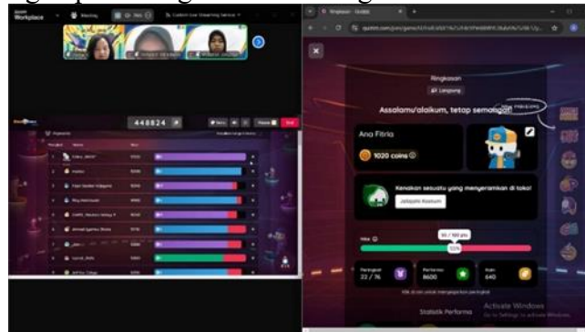
Gambar 5. Sesi game Quiz

Sesi ketiga, sesi tanya jawab para generasi muda berkesempatan menanyakan pertanyaan kepada narasumber. Adanya sesi ini untuk menjawab rasa penasaran para generasi muda. Para peserta antusias menanyakan permasalahan yang terjadi saat berinvestasi. Narasumber memberikan Solusi kepada generasi muda atas permasalahan dan resiko yang akan dihadapi dalam berinvestasi. Para peserta dalam sesi ini mendapatkan pengetahuan dalam berinvestasi yang sesuai dengan kemampuannya. Adanya sesi ini para generasi muda diharapkan terhindari dari investasi ilegal yang dapat merugikan finansial generasi muda.