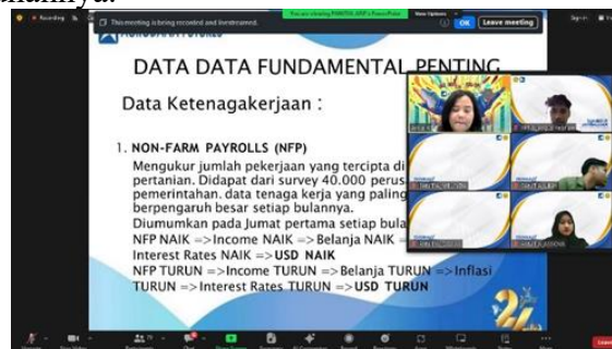
Gambar 4. Sesi tanya jawab

Sesi kedua, narasumber memberikan edukasi dan arahan tentang forex factory dan trading demo meta trade 4 untuk meningkatkan pemahaman tentang perdagangan berjangka komoditi khususnya didunia trading atau investasi. Para peserta diberikan ilustrasi sederhana terkait proses transaksi trading menggunakan meta trade 4 dan juga para peserta diberikan ilustrasi analisis fundamental dengan melihat berita di forex factory. Ilustrasi tersebut dimaksudkan agar para generasi muda lebih muda dalam menentukan dalam memulai investasi yang sesuai dengan kebutuhannya.