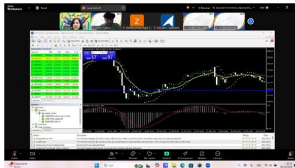
gambar 3. Sesi pemaparan demo trading

sesi pertama para peserta sosialisasi diberikan pengetahuan dasar dari investasi serta tujuan dari investasi. Dalam investasi khususnya trading ada dua analisis yaitu analisis fundamental dan teknikal. Narasumber memberikan pengetahuan tentang pentingnya analisis fundamental dan teknikal untuk perencanaan investasi. Dengan meningkatkan pengetahuan akan membantu generasi muda untuk menggunakan keuangan dengan bijak dan juga memberikan manfaat untuk masa depan yang baik dan Sejahtera. Analisa fundamental pada umumnya analisis yang didasarkan melalui berita laporan keuangan suatu negara. Sementara itu, analisa teknikal ialah analisa yang berdasarkan pada data-data mengenai harga historis yang terjadi pada pasar saham. Dalam penerapan analisa teknikal, prediksi untuk membeli atau menjual saham dilakukan dengan melihat grafik historis pergerakan saham. Dengan adanya rencana investasi diharapkan generasi muda tidak lagi mengalami kesulitan dalam memulai berinvestasi.